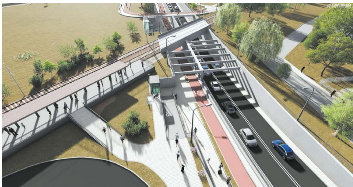
Wizualizacja przedstawia rozwiązanie komunikacyjne przy Grunwaldzkiej po zakończeniu inwestycji

Investycja ułatwi dojazd do miasta wszystkim, którzy dzisiaj tracą mnóstwo czasu w potężnych korkach. Na tunel długo czekają zarówno mieszkańcy gminy Komorniki, jak i poznanicy. Dzisiaj ul. Grunwaldzką w ciągu doby przejeżdża blisko 10 tys. pojazdów, a z przecinającą ją linią kolejową korzysta około 130 pociągów. Biorąc pod uwagę, że jest to trasa, która umożliwia dojazd do autostrady A2 oraz drogi krajowej nr 5, wybudowanie węzła w tym miejscu jest koniecznością. Powstanie on w pobliżu stacji kolejowej Poznań Junikowo. Pod torami przebiegać będzie tunel ułatwiający szybki, bezkolizyjny przejazd oraz przejście dla pieszych. Dodatkowo w ciągu ul. Grunwaldzkiej, na odcinku od ul. Twardogórskiej do Wołczyńskiej, powstanie droga łącząca ją z ul. Piwonową i Szarotkową. Chodniki i ścieżki rowerowe zwiększą bezpieczeństwo pieszych i rowerzystów. Planowana infrastruktura podniesie też atrakcyjność komunikacji publicznej, która